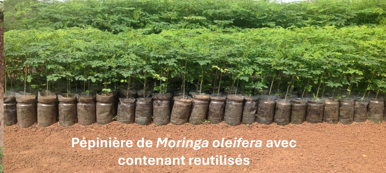
Pépinière de Moringa oleifera avec contenant reutilisés