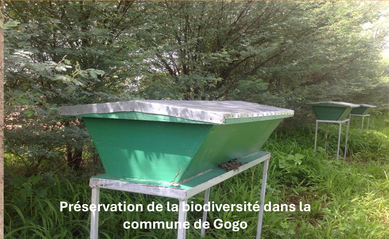
Préservation de la biodiversité dans la commune de Gogo