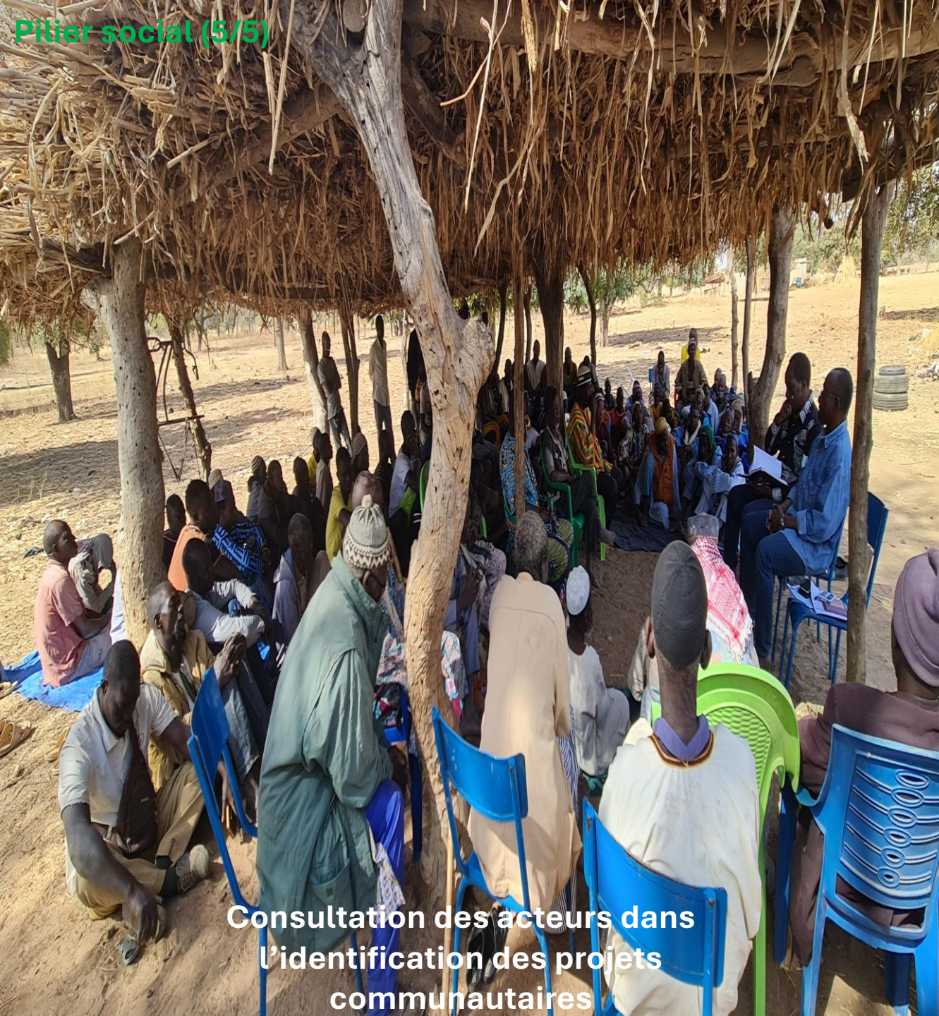
Consultation des acteurs dans l'identification des projets communautaires