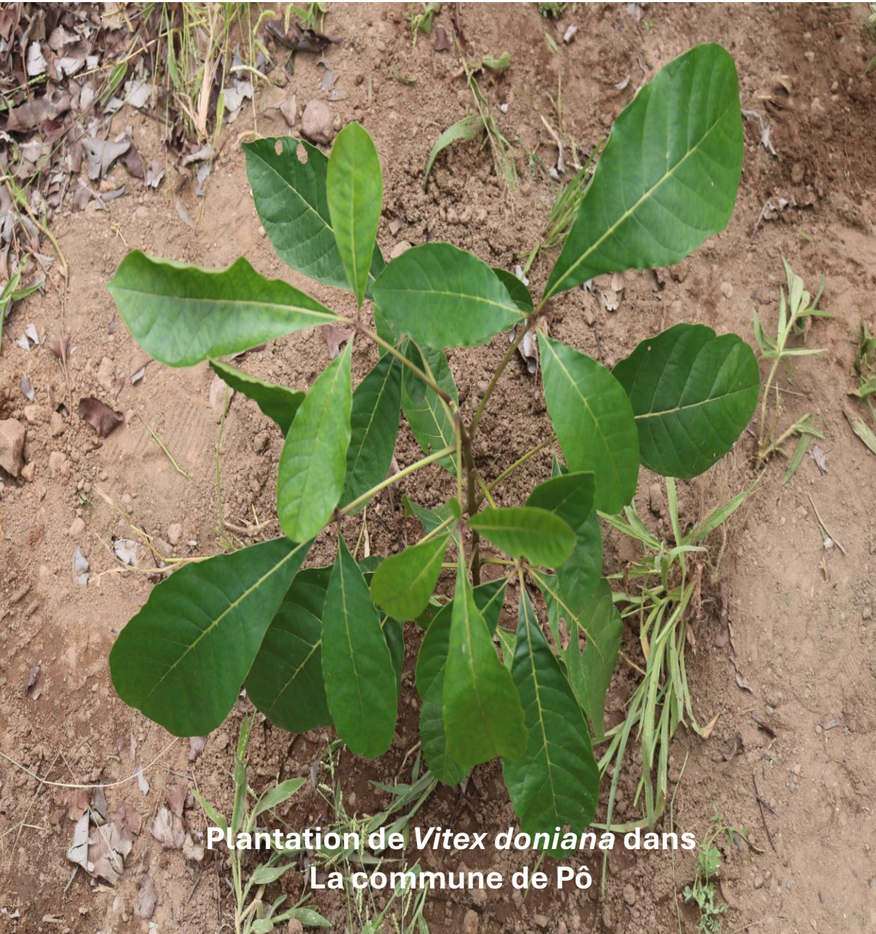
Plantation de Vitex doniana dans La commune de Pô